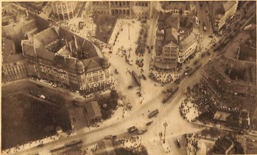
375 Berlin, Blick auf Potsdamer- und Leipziger-Platz