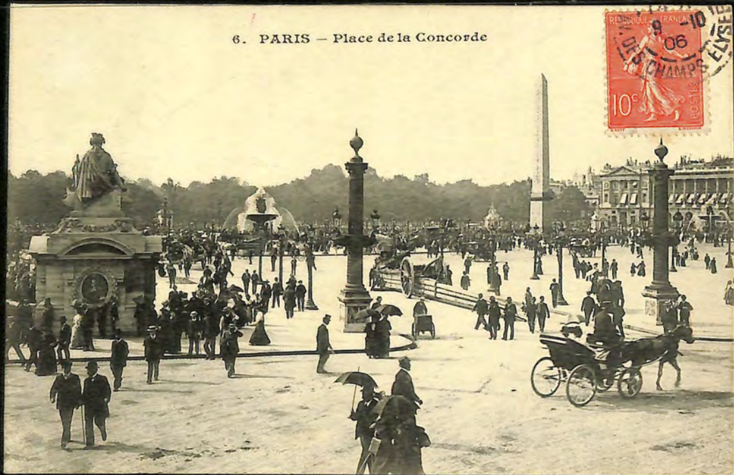
6. PARIS - Place de la Concorde