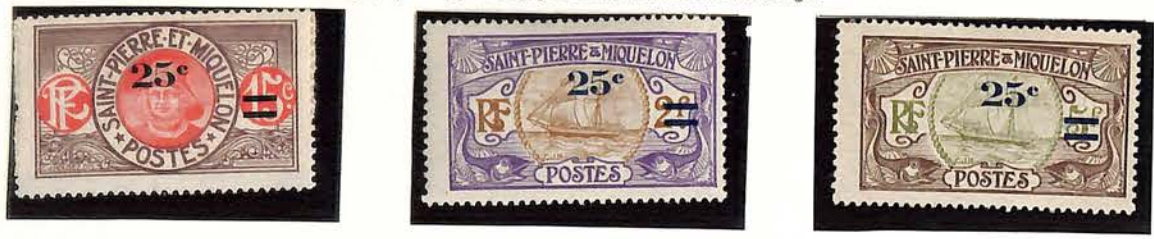
1924-27. — Types de 1909 avec nouvelle valeur en surcharge.