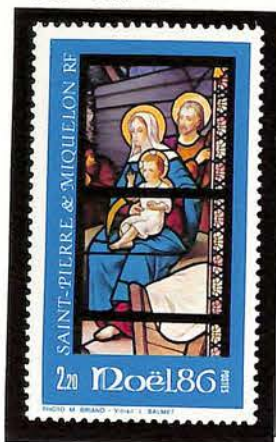
1986. — Noël. Vitrail. Dentelé 13.