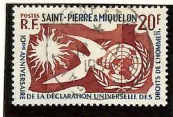
1958. — 10 e anniversaire de la Déclaration universelle des Droits humains. Dent. 13.