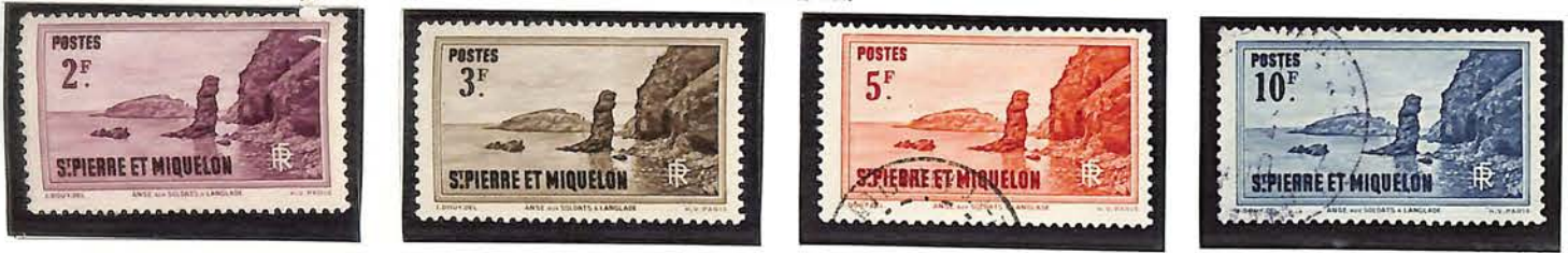
Anse aux Soldats.