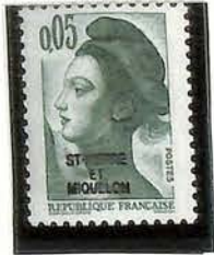
1986. — Série courante. T.-P. de France (Liberté de Gandon) surchargés « ST-PIERRE ET MIQUELON ».