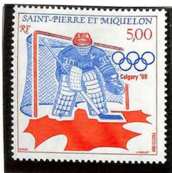
1988. — Jeux olympiques d'hiver, à Calgary. Dentelé 13.