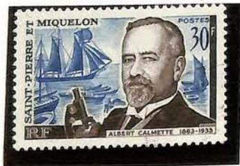
1963. — Centenaire de la naissance d'Albert Calmette. Dent. 13.