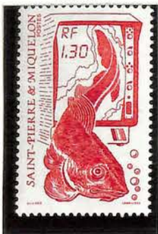
1988. — Série courante. Dentelé 13.