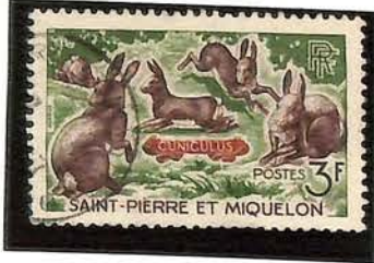
1964. — Animaux. Dentelés 13.