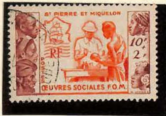
344 1950. — Œuvres sociales. Dent. 13.