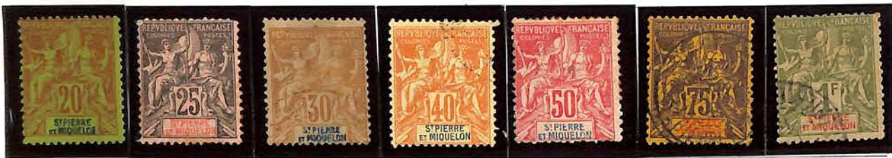
1900-08. — Id.