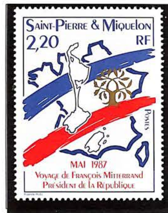
1987. — Visite de François Mitterrand, Président de la République. Dentelé 12½ x 13.