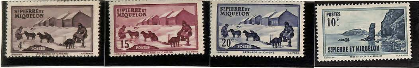
1942. — Types des timbres de 1938 sans R. F. Dentelés 13 1/2.