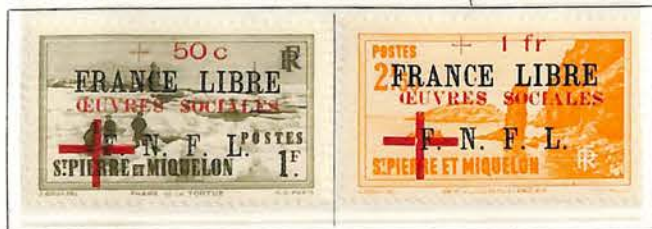
1942. — Timbres de 1941 avec plus-value, ŒUVRES SOCIALES et croix en surcharge.