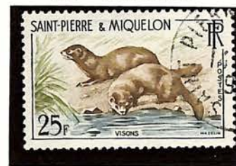
1959. — Visons. Dent. 13.