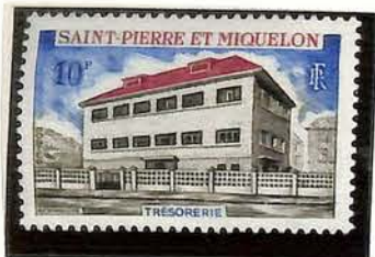
1969. — Monuments et bâtiments. Dentelés 13.