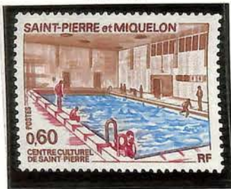
1973. — Centre culturel de Saint-Pierre. Dentelé 13.