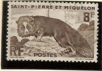
343 1952. — Renard argenté. Dent. 13.