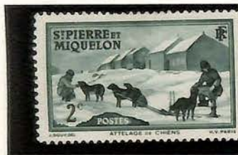
1938. — Attelage de chiens. Dentelés 13 1/2.