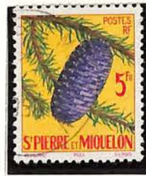
1958. — Picea. Dent. 12 1/2.