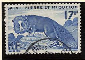
1952. — Renard argenté. Dent. 13.