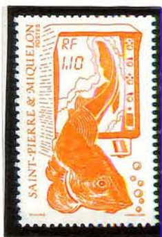
1987. — La pêche. Type du T.-P. de 1986. Dentelé 13.