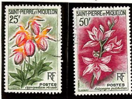
1962. — Fleurs. Dent. 13.