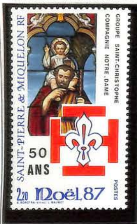
1987. — Noël, et 50 e anniversaire du scoutisme aux îles. Dentelé 13.