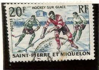
1959. — Hockey sur glace. Dent. 13.