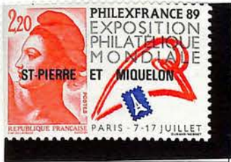
1988. — « Philexfrance '89 », Exposition philatélique mondiale, à Paris. T.-P. de France de 1988 surchargé.