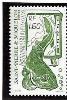
1988. — Série courante. Dentelé 13.