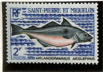
1972. — Poissons. Dentelés 13.