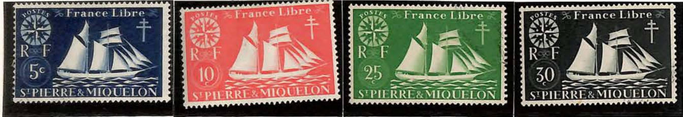
1942. — Voilier et croix de Lorraine. Dentelés 13 1/2 x 14.