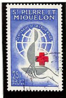
1963. — Centenaire de la Croix Rouge internationale. Dent. 13.