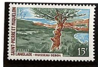
1969. — Ruisseau Debon, à Langlade. Dent. 13.