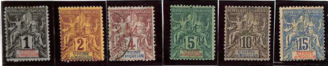
1892. — Groupe allégorique S-PIERRE ET MIQUELON dans le cartouche du bas. Dentelés 14 x 13 1/2.