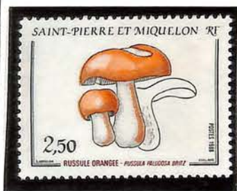
1988. — Flore. Champignon. Dentelé 12 1/2.