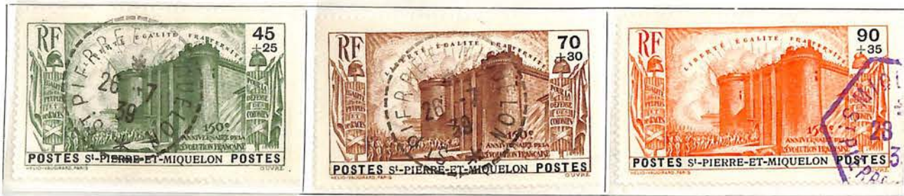
1939. — Commémoratifs du 150 e anniversaire de la Révolution. Dentelés 13 1/2 x 13.