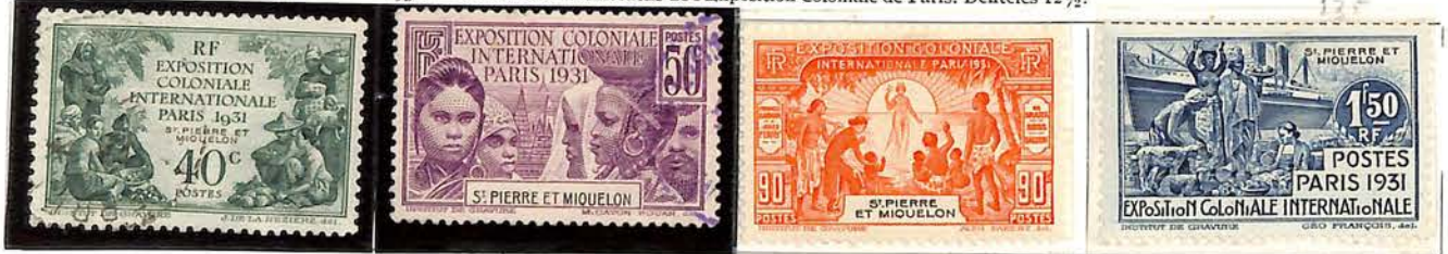
1931. — Timbres commémoratifs de l'Exposition Coloniale de Paris. Dentelés 12 1/2.