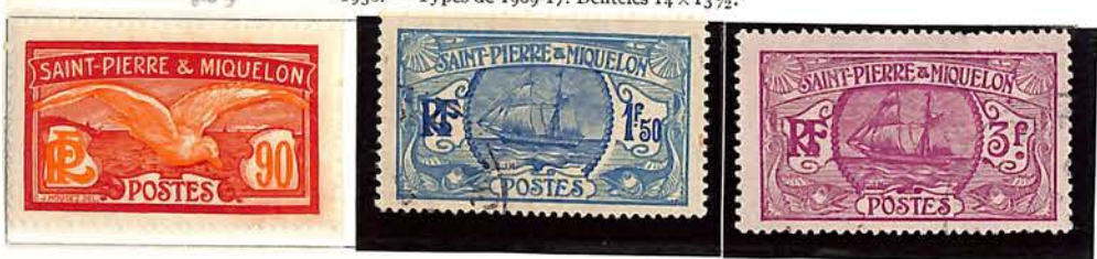
1930. — Types de 1909-17. Dentelés 14 x 13 1/2.