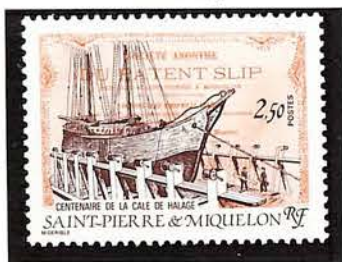
1987. — Centenaire de la cale de halage. Dentelé 13 x 12½.