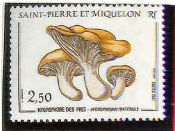
1987. — Flore. Champignon. Dentelé 12½.