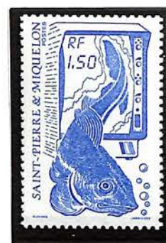
1987. — La pêche. Type du T.-P. de 1986. Dentelé 13.