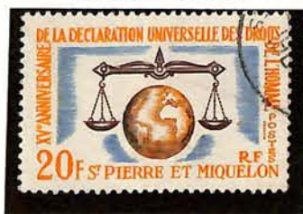
1963. — 15 e anniversaire de la Déclaration universelle des Droits humains. Dent. 13.