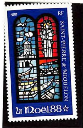
1988. — Noël. Dentelé 13.