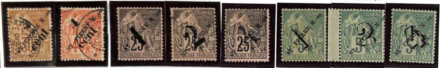
Gros chiffre à fond plein.