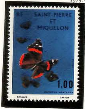
1975. — Papillons. Dentelés 12 1/2 x 13.