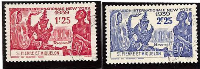
1939. — Commémoratifs de la participation à l'Exposition de New-York. Dentelés 12 1/2.