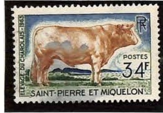
1967. — Dentelés 13.