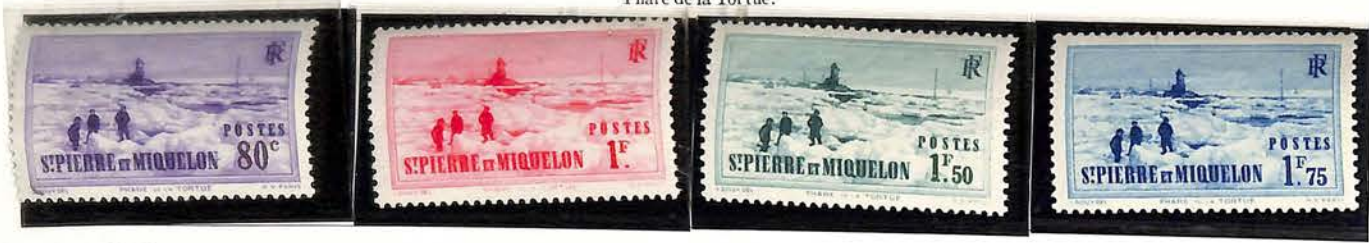
1938. — Dentelés 13 1/2. Phare de la Tortue.