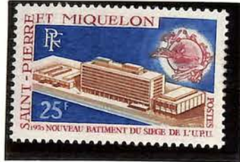
337 1970. — Nouveau bâtiment de l'U.P.U. à Berne. Dentelés 13.