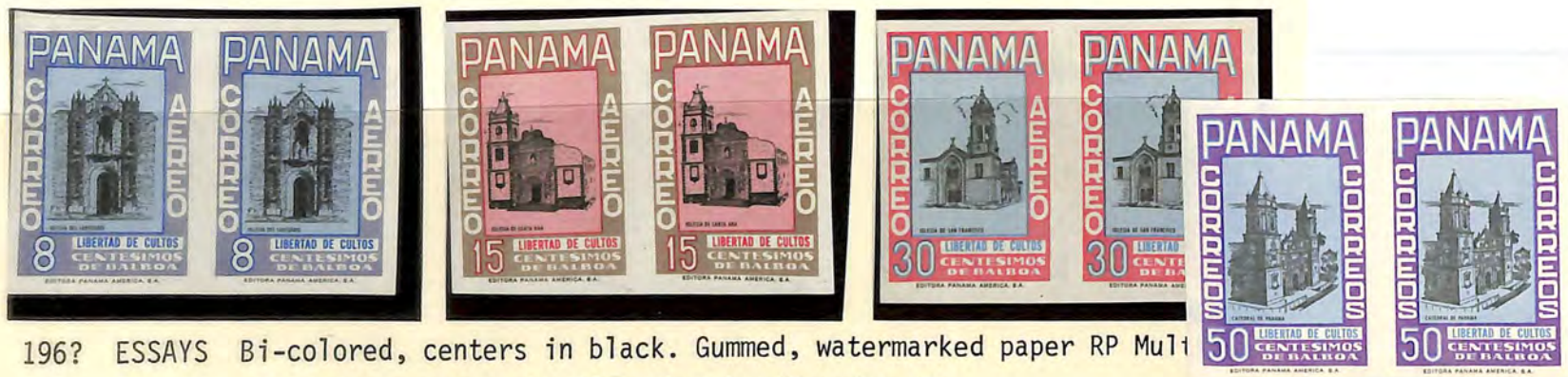
196? ESSAYS Bi-colored, centers in black. Gummed, watermarked paper RP Mu11 Proposed designs for the 1962 Churches/Freedom of