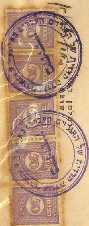
May 5, 1949 Unusual headed paper of "Ha'Orez {the Packer} Coop. Society of the Hebrew Packers of Eretz-Israel", Petah Tiqva, Eretz-Israel". Has "COURT" at upper left & "VERDICT" underneath title (both in bold letters). Since orange packers were all over Eretz-Israel & in rather great numbers, the Coop Society established an internal court of its own. In this case, one of the packers initiated a quarrel... he was found guilty in a few counts, hence will not be promoted for two years... and "...will pay 250 Mils as Court Fees, as well as 350 Mils for revenue stamps required". Signed by the society's judge, Franked 5 x 250 Pr. tied by x2 Society's Court hstmp. Apparently the other 100 Mils were for certified copies. Very scarce! $32

פסק-דין זה, ניתן ביום 5.5.49, וניתן לערעור תוך 30 ימים מיום קבלתו.