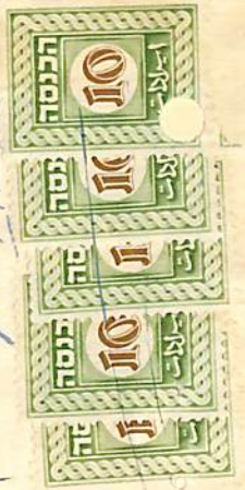
Receipt for 100 IL. (apparently cash) received for a blueprint of the bakery premises of the Even Ha'ezer council.