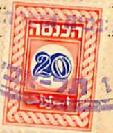
March 7, 1954 INCOME CERTIFICATE PAIR. Official "State of Israel - Treasury, Dept of Collection & Property Taxes". Southern district, Petah Tiqva, for plot #247 (630 sq. meters) transferred by "I.B.H. Israeli Co. for Construction, Engineering & General Trade Ltd.", to private purchasers. Has 4-line handstamp of the Land Registrar: "I have no objection to register the transaction above, as long as transaction will be executed till March 31, 1954". Signed & hstmpd (lower left) by the Treasury inspector, TLV District & by the Land Registrar, this oval hstmp tying 20Pr. revenue stamp to certificate. Form has Printers' legend at low right, dated May 1951. The second piece is similar but for the next plot #248 of same size; all other details are identical. Uncommon! $32 for the pair, $17 for a single piece.

תאריך: 7-10-1954. 102 - V.51 - 100.000. המפקד המחוזי של האוצר: ממו תל-אביב