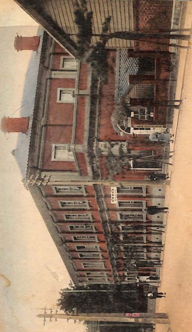
Post Office, Nagasaki.