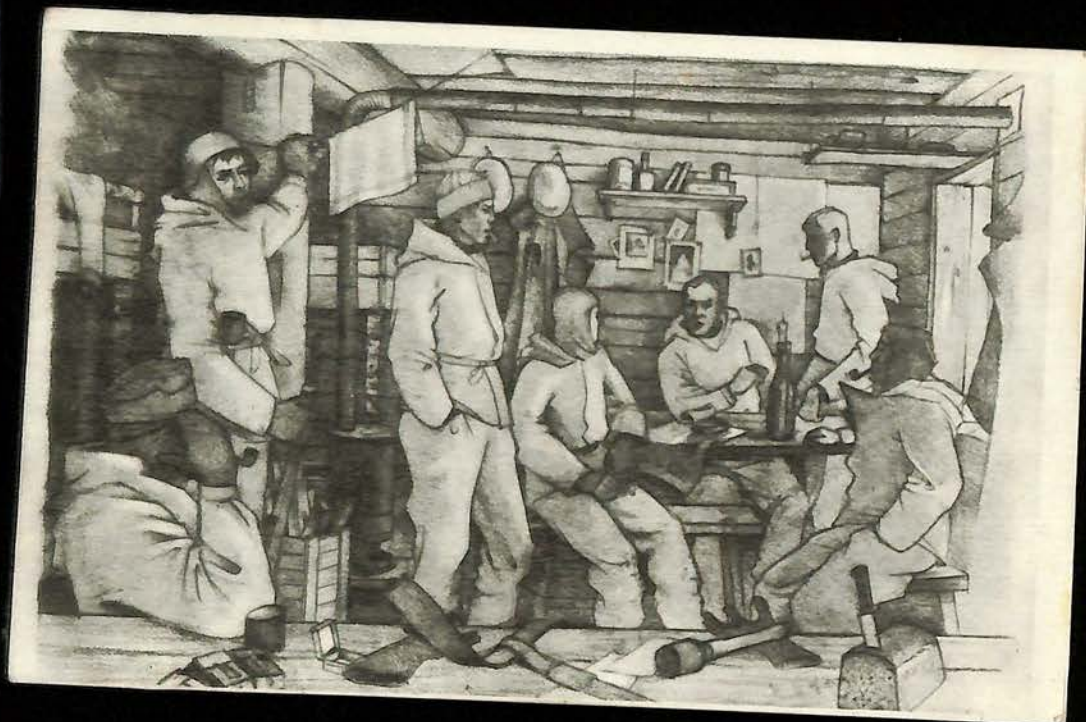
WWII FELDPPOST PC DEPICTING LIFE IN A BUNKER. POSTED 5.44. W/ FELDPPOST NR. 08361 B (STAB III UND 9.-12. KOMPA-NIE LETTISCHES POLIZEI - GRENZ - SCHUTZ - REGIMENT 5.) SENT TO MEME-LÉS PAG. STRADOS, P.P. N. FRIEGALE (ART BY LATVIAN ARTIST WOLFGANG LEJA, KRIEGSMALER).