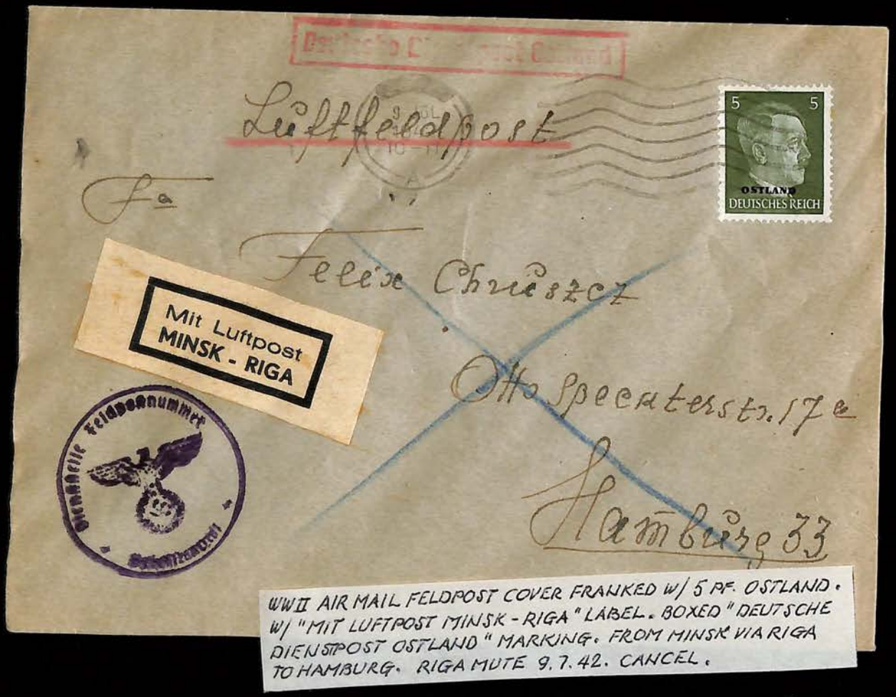
WWII AIR MAIL FELDPPOST COVER FRANKED W/ 5 PF. OSTLAND. W/ "MIT LUFTPOST MINSK - RIGA" LABEL. BOXED "DEUTSCHE DIENSTPOST OSTLAND" MARKING. FROM MINSK VIA RIGA TO HAMBURG. RIGA MUTE 9.7.42. CANCEL.