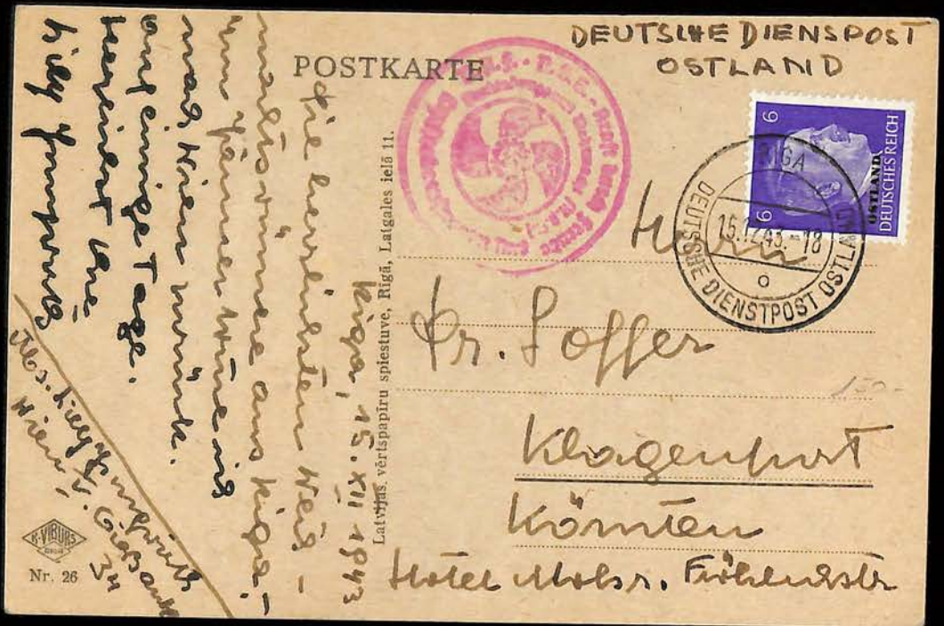
WWII SHIP MAIL PC FROM GERMAN "KRAFT DURCH FREUDE" SHIP, WEHRMACHT ON THE BALTIC SEA. FRANKED W/ 6PF. OSTLAND. RED SHIP MARKING. RIGA 15.12.1943 CANCEL.