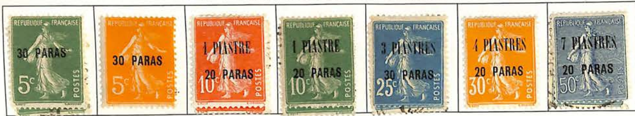
1921-22. — Timbres de France de 1900-21 avec nouvelle valeur en surcharge.