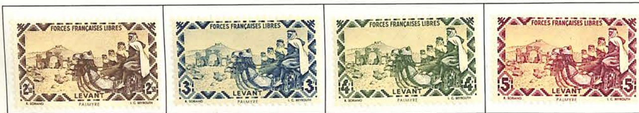
1943. — Mêmes timbres avec RÉSISTANCE et plus-value en surcharge.