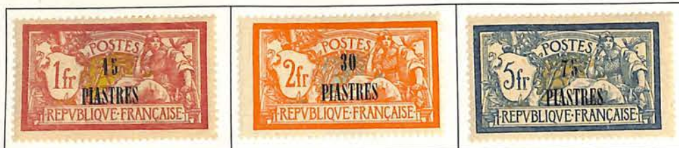
1923. — Timbres de France de 1903-06 avec surcharge apposée à la main.