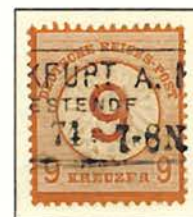
9 a. 9 Kreuzer