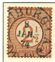
2 1/2 a. 2 1/2 Groschen