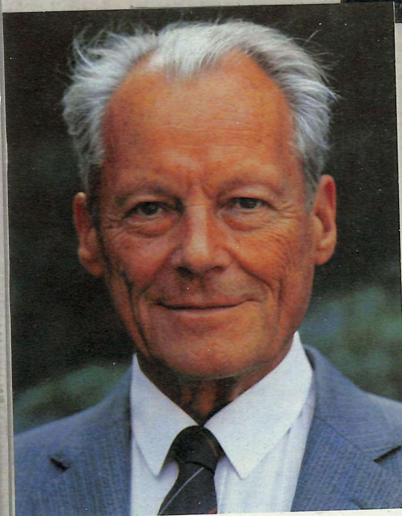
WILLY BRANDT 1913-92 Ger. Chanc. Nobel Signed photo Signed CARD $35-