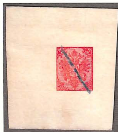
Reverse Side 2(Kr) Red Defaced With Blue Crayon

New Discoveries, Previously Unrecorded • Both Attest "Soecknick"