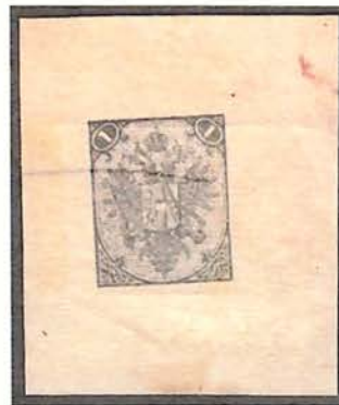
Reverse Side Showing Impression of 1(Kr) Grey with Faint Crayon Invalidation