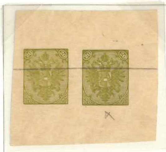
20(Kr) Yellow-green Two Impressions with Crayon Invalidation