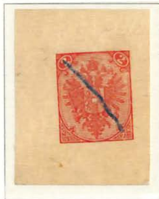
2(Kr) Red Defaced with Printer's Blue Crayon