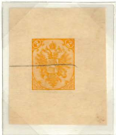
2(Kr) Orange Single Blue, Horizontal Crayon Invalidation