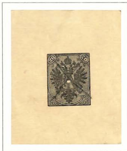
20(Kr) Black, Heavy Impression Single Blue Cross Invalidation by Printer • No Impression on Reverse

New Discoveries, Previously Unrecorded • Both Attest "Soecknick"