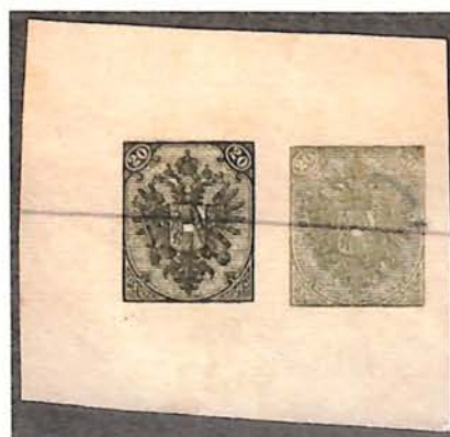
Reverse Side Two Impression of 20(Kr) in Different Shades