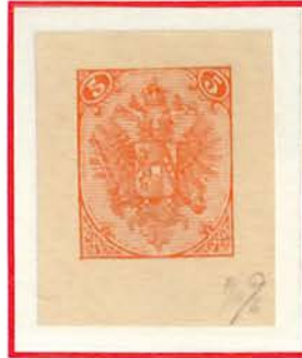
5(Kr) Red (1895), Type III

In Issued Color On Yellowish Carton Paper