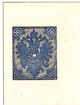
Reverse Side Shows Impression of 10(Kr) Blue