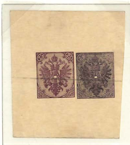
25(Kr) Reddish-mauve (Clear) and 25(Kr) Deep Reddish-mauve (Very Blurred) with Faint Crayon Printer's Invalidation